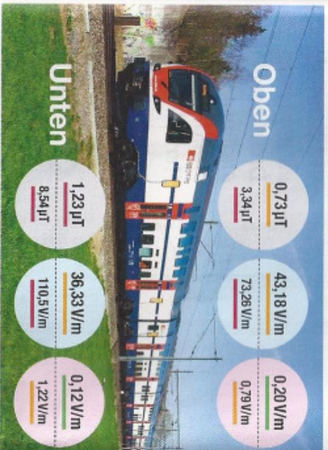
Doppelstockwagen Dosto-Kiss (3. Generation)