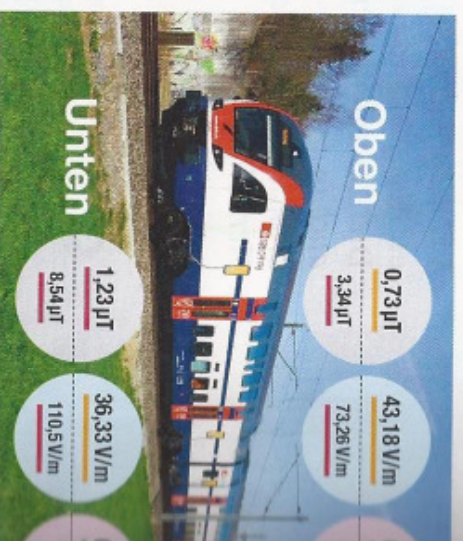
Doppelstockwagen Dosto-Kiss (3. Generation)

Die gute Nachricht: Die durch WLAN, Handys oder weitere Funknetze verursachte Belastung (hochfre-