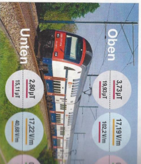
Doppelstockwagen Dosto-Siemens (2. Generation)