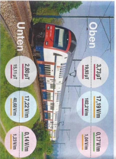
Doppelstockwagen Dosto-Siemens (2. Generation)